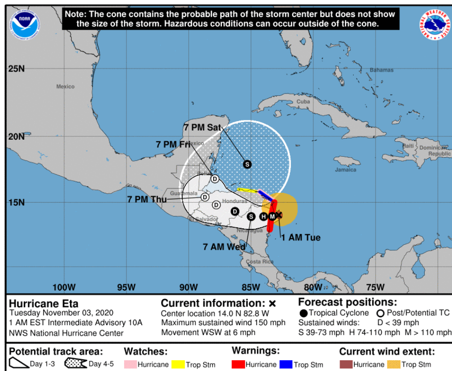
Gráfica 2. Cono de la posible trayectoria de la tormenta tropical ETA para los siguientes días. NHC-National Hurricane Center 2 de noviembre de 2020. Hora 22:00 HLC.