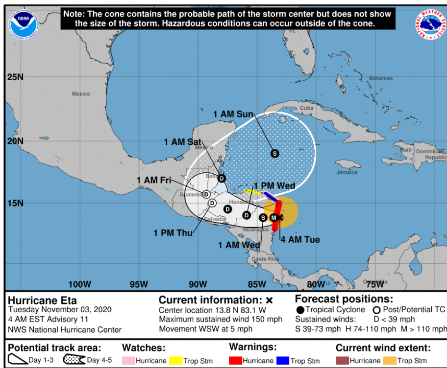
Gráfica 2. Cono de la posible trayectoria de la tormenta tropical ETA para los siguientes días. NHC-National Hurricane Center 3 de noviembre de 2020. Hora 04:00 HLC.