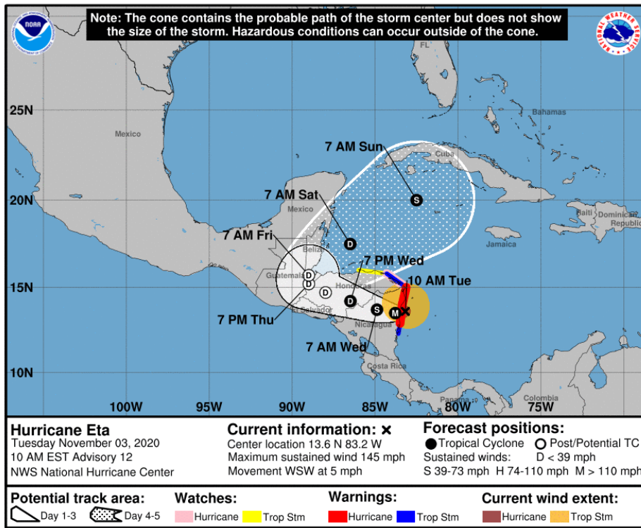
Gráfica 2. Cono de la posible trayectoria del huracán Eta para los siguientes días. NHC-National Hurricane Center 3 de noviembre de 2020. Hora 10:00 HLC.