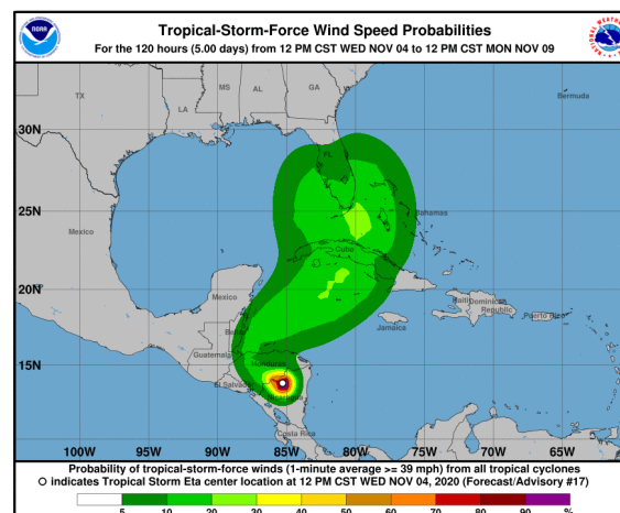
Gráfica 3. Cono de la probabilidad de la fuerza de los vientos ciclónicos de Eta para los siguientes días. NHC-National Hurricane Center 4 de noviembre de 2020. Hora 16:00 HLC.

Cualquier inquietud adicional relacionada con este comunicado, podrá consultarse con el meteorólogo de turno al celular 3208412346 o al teléfono (031)-3527160, extensión 1334 de la ciudad de Bogotá D.C.