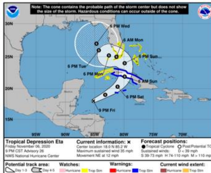
Gráfica 2. Cono de la posible trayectoria de la depresión tropical Eta para los siguientes días. NHC-National Hurricane Center 6 de noviembre de 2020. Hora 21:00 HLC.

Por otra parte, de acuerdo con el pronóstico para Oleaje en el Caribe del CIOH (Centro de Investigaciones Oceanográficas e Hidrográficas) en el Occidente de San Andrés y Providencia, se podrían presentar alturas entre 1.5 - 2.5 durante el día de mañana 07 de noviembre, como se puede evidenciar en la figura presentada a continuación.