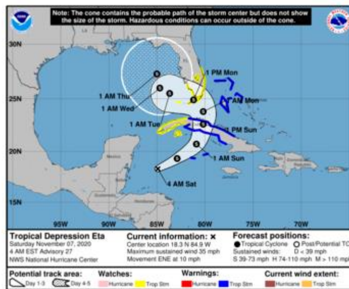
Gráfica 2. Cono de la posible trayectoria de la depresión tropical Eta para los siguientes días. NHC-National Hurricane Center 07 de noviembre de 2020. Hora 04:00 HLC.

Por otra parte, de acuerdo con el pronóstico para Oleaje en el Caribe del CIOH (Centro de Investigaciones Oceanográficas e Hidrográficas) en el Occidente de San Andrés y Providencia, se podrían presentar alturas entre 1.5 - 2.5 durante el día de mañana 07 de noviembre, como se puede evidenciar en la figura presentada a continuación.