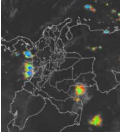
Imagen GOES 13 - IDEAM * 31 de agosto de 2014 * Hora 8:15 a.m. HLC.