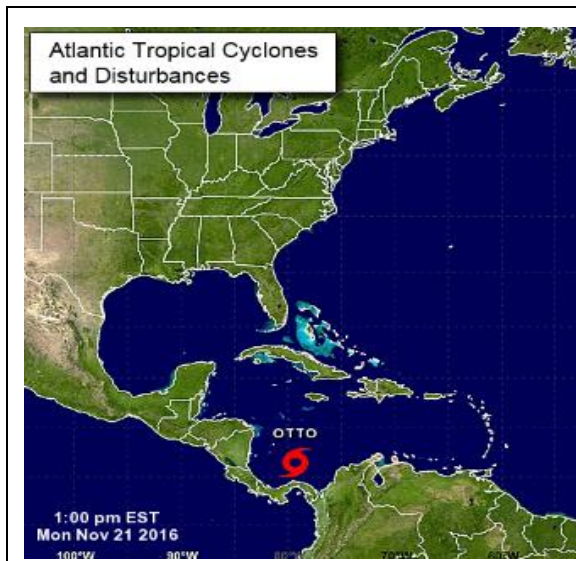
Figura 1. Ubicación de la tormenta Tropical OTTO de acuerdo con el NHC.

Se espera que los vientos se intensifiquen para las próximas 48 horas. También es posible que Otto pueda convertirse en huracán durante el mismo periodo. La tormenta tropical seguirá una trayectoria hacia el oeste-suroeste, como lo muestra la Figura 2.