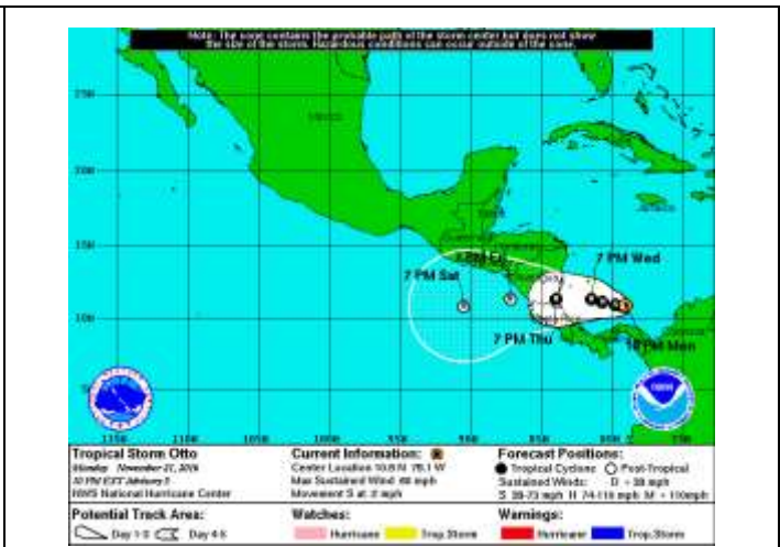
Figura 2. Trayectoria probable de la tormenta Tropical OTTO de acuerdo con el NHC.

De acuerdo a las observaciones reportadas en el Archipiélago de San Andrés y Providencia, en las últimas 4 horas se ha registrado cielo entre parcial y mayormente nublado con predominio de tiempo seco y vientos fuertes, los cuales han alcanzado ráfagas alrededor de los 27 nudos (50 km/h aproximadamente). Se estima que las bandas de nubosidad de Otto incrementen las lluvias en la zona insular con cantidades que podrían ir desde 70 hasta 150 milímetros en las próximas 24 a 48 horas (figura 3).