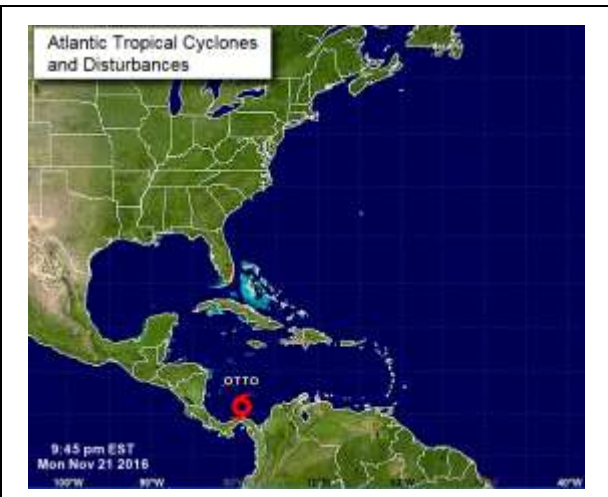
Figura 1. Ubicación de la tormenta Tropical OTTO de acuerdo con el NHC.

Se espera que los vientos se intensifiquen para las próximas 48 horas. También es posible que Otto pueda convertirse en huracán durante el mismo periodo. La tormenta tropical seguirá una trayectoria hacia el oeste, como lo muestra la figura 2.