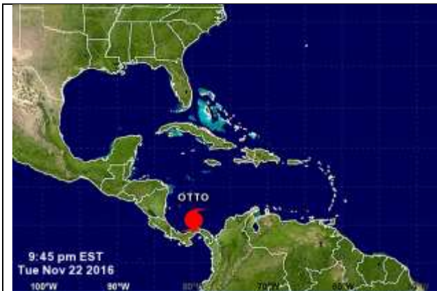
Figura 1. Ubicación del huracán OTTO de acuerdo con el NHC; reporte de las 22:00 HLC.

El huracán OTTO de Categoría 1 se mueve ahora un poco más que en horas anteriores, dirigiéndose en dirección oeste-noroeste hacia el occidente del mar Caribe con una velocidad de 6 km/h. De acuerdo con el último informe del Centro Nacional de Huracanes (NHC, por sus siglas en inglés), el centro del sistema se ubica en las coordenadas 10.7° de latitud norte y 79.8° de longitud oeste, a una distancia aproximada de 254 km de San Andrés y 318 km de Providencia (ver figura 1).