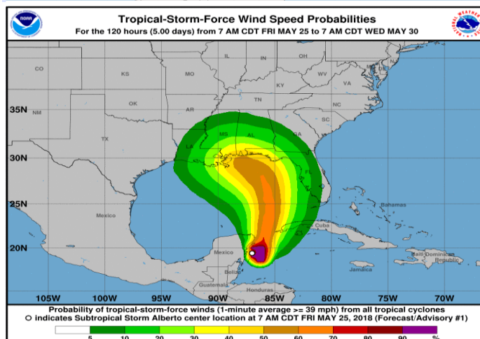
Figura 1. Ubicación de la Tormenta Subtropical ALBERTO (arriba) y cono de probabilidad de desplazamiento y vientos fuertes (abajo).

El IDEAM continuará monitoreando la evolución de las condiciones hidrometeorológicas asociadas a la interacción con sistemas tropicales propios de la temporada de Ciclones Tropicales en el océano Atlántico y el Caribe colombiano, por lo cual recomienda a las entidades del Sistema Nacional para la Gestión del Riesgo de Desastres y a las del Sistema Nacional Ambiental, estar atentos a los documentos que emita el instituto.